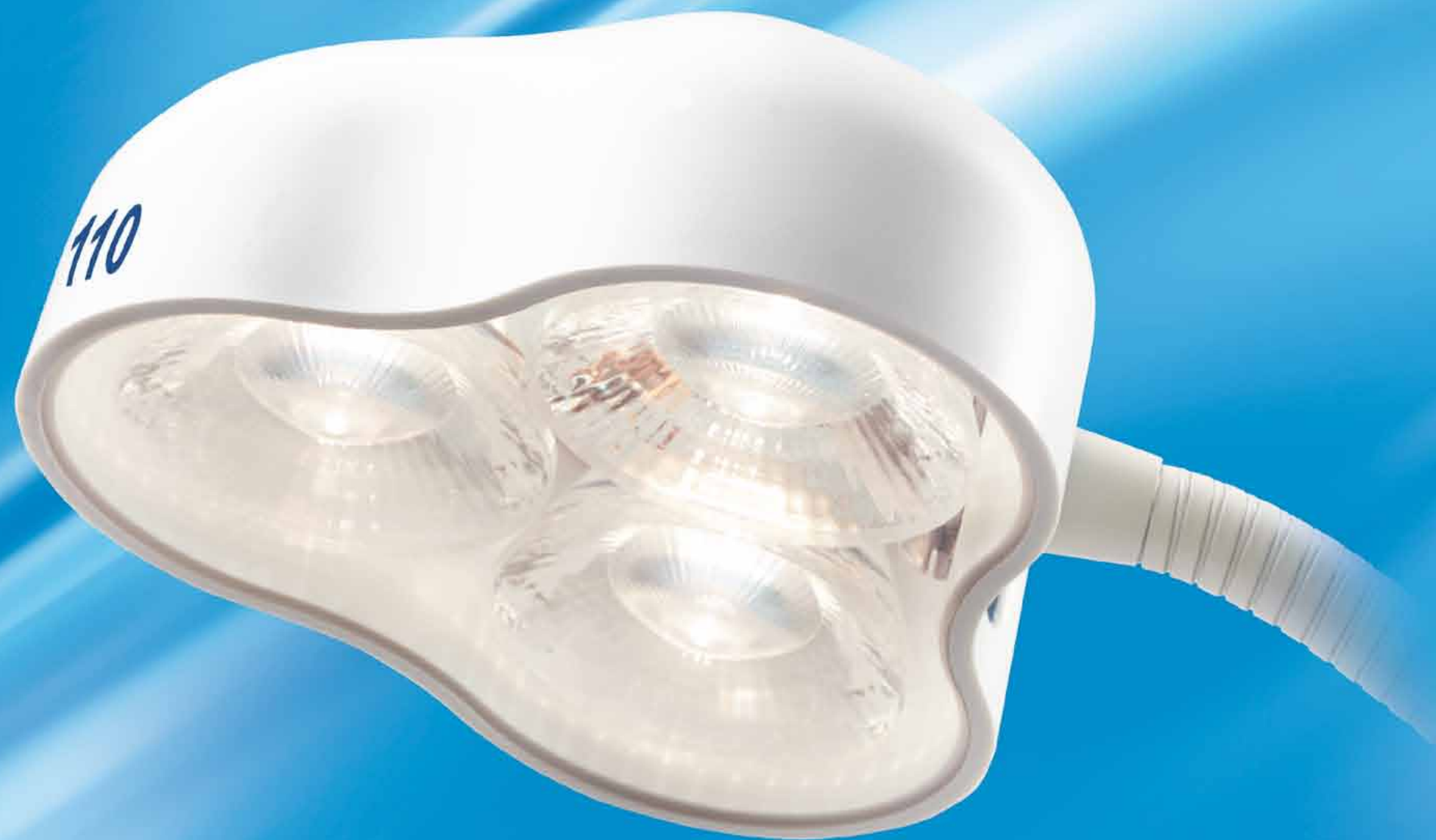
Mach LED 110 30.000 Lux (0,5 m Abstand)

Kompakte Untersuchungsleuchte mit LED-Technologie für Diagnose und Prophylaxe