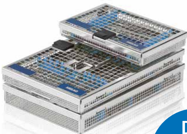
MELAstore – Trays

Durch die sichere Verwahrung der Instrumente im MELAstore-System wird der Schutz für das Praxisteam und für die Instrumente erhöht.